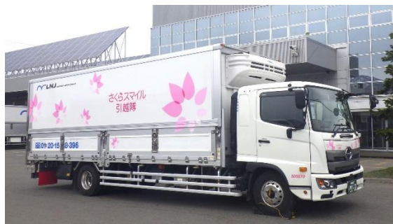
定温輸送対応トラック