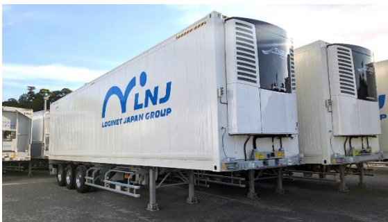
定温輸送対応トレーラー

札幌通運は、2026年度より、厳しさを増す気候変動と多様化する顧客ニーズに対応するため、全道で定温輸送対応車両を増車するとともに、札幌圏の主力倉庫の定温化対応を強化し、気候環境に最適化した物流サービスを拡充します。